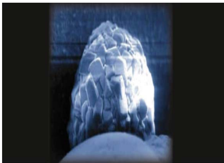
Fotografia kryształu zrobiona za pomocą elektroskopu atomowego.

Miejsca tworzenia się zarodków krystalizacji, rozmieszczone na powierzchni małych ceramiczno-polimerowych sfer (paciorków), zamieniają substancje wpływające na twardość wody w mikroskopijne kryształy